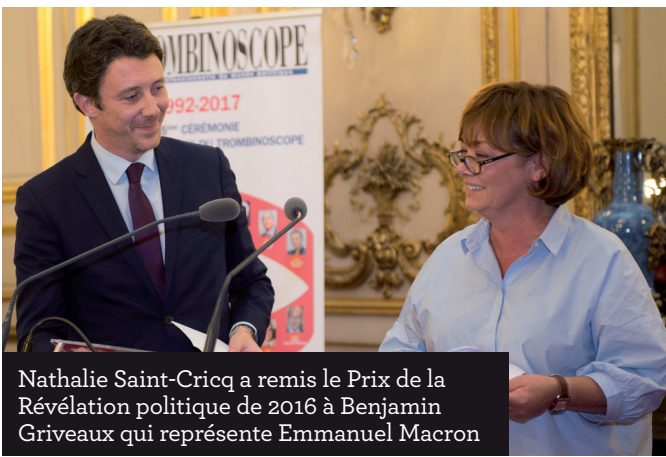
Nathalie Saint-Cricq a remis le Prix de la Révélation politique de 2016 à Benjamin Griveaux qui représente Emmanuel Macron