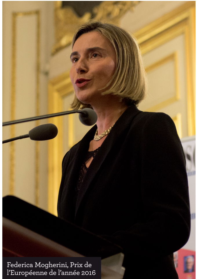
Federica Mogherini, Prix de l'Européenne de l'année 2016