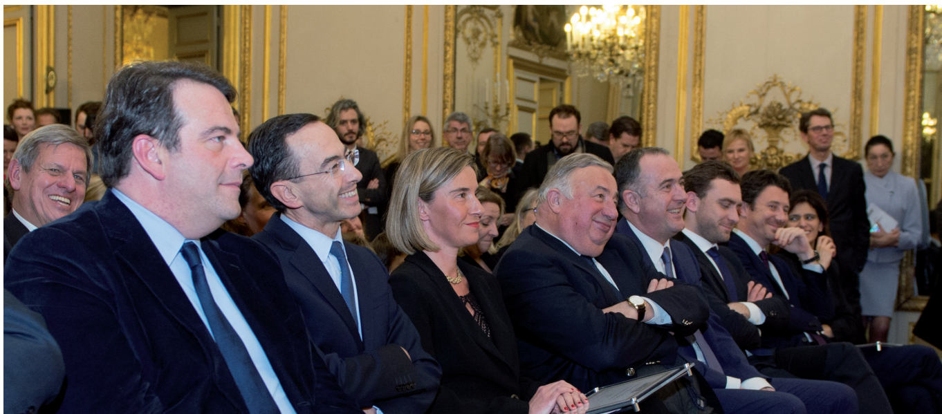
(De gauche à droite) Thierry Solère, Bruno Retailleau, Federica Mogherini, Gérard Larcher, Didier Guillaume, Julien Dive, Benjamin Griveaux