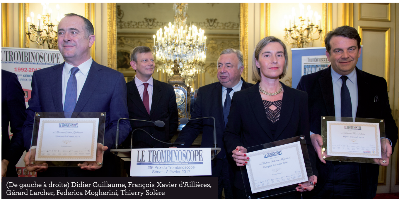
(De gauche à droite) Didier Guillaume, François-Xavier d'Aillières, Gérard Larcher, Federica Mogherini, Thierry Solère