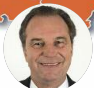
Renaud MUSELIER (Les Républicains) www.maregionsud.fr