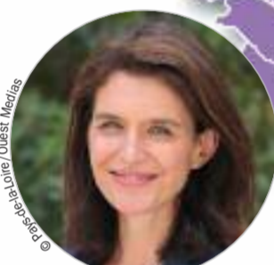
Christelle MORANÇAIS (Les Républicains) www.paysdelaloire.fr