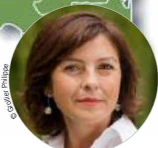
Carole DELGA (PS) www.laregion.fr