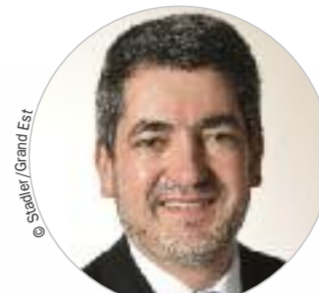
Jean ROTTNER (Les Républicains) www.grandest.fr