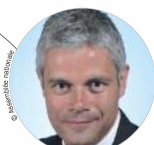
Laurent WAUQUIEZ (Les Républicains) www.auvergnerrhonealpes.fr