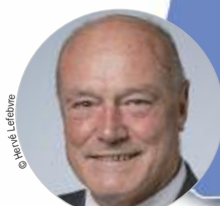
Alain ROUSSET (PS) www.nouvelle-aquitaine.fr