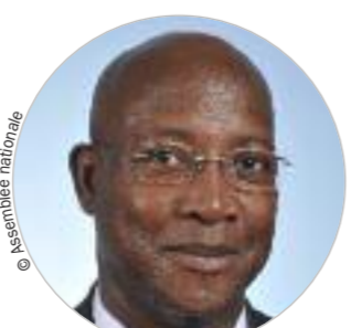
Assemblée Gabriel SERVILLE (DVG) www.ctguyane.fr