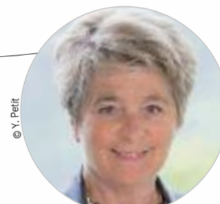
Marie-Guite DUFAY (PS) www.bourgognefranche-comte.fr