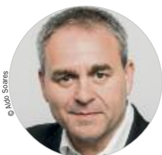
Xavier BERTRAND (DVD) www.hautsdefrance.fr