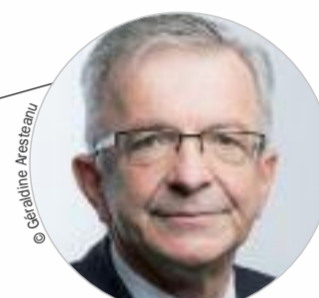
François BONNEAU (PS) www.regioncentre-valde Loire.fr