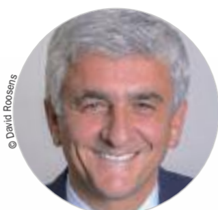
Hervé MORIN (Les Centristes) www.normandie.fr