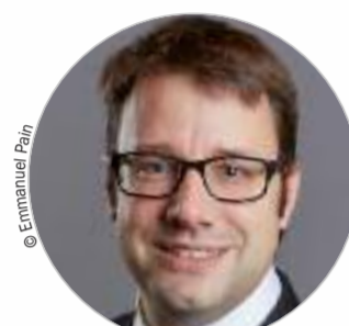
Loïc CHESNAIS-GIRARD (PS) www.bretagne.bzh