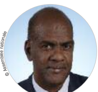
Conseil exécutif Serge LETCHIMY (PS) www.collectivitedemartinique.mq