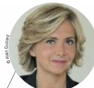
Valérie PÉCRESSÉ (DVD) www.iledefrance.fr