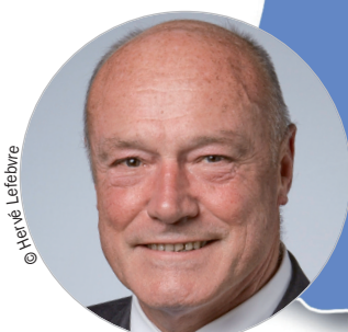
Alain ROUSSET (PS) www.nouvelle-aquitaine.fr