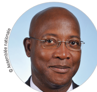
Assemblée Gabriel SERVILLE (DVG) www.ctguyane.fr