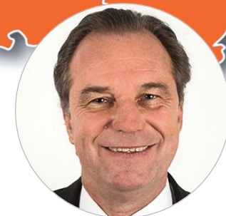
Renaud MUSELIER (DVD) www.maregionsud.fr