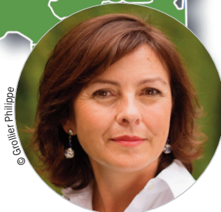
Carole DELGA (PS) www.laregion.fr