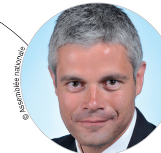
Laurent WAUQUIEZ (Les Républicains) www.auvergnerhonealpes.fr