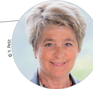
Marie-Guite DUFAY (PS) www.bourgognefranche-comte.fr