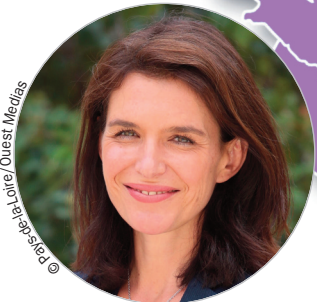
Christelle MORANÇAIS www.paysdelaloire.fr