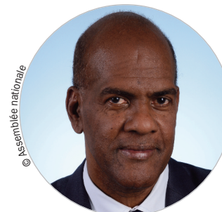
Conseil exécutif Serge LETCHIMY (PS) www.collectivitedemartinique.mq