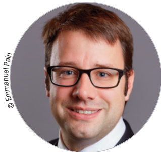
Loig CHESNAIS-GIRARD (PS) www.bretagne.bzh