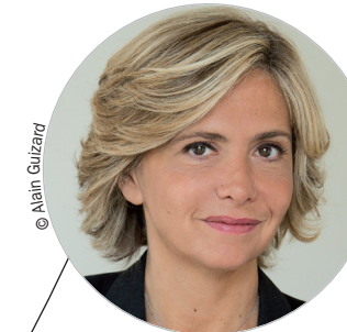
Valérie PÉCRESSE (DVD) www.iledefrance.fr