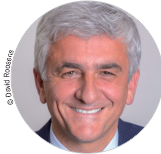
Hervé MORIN (Les Centristes) www.normandie.fr