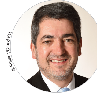
Jean ROTTNER (Les Républicains) www.grandest.fr