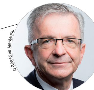
François BONNEAU (PS) www.regioncentre-valde Loire.fr